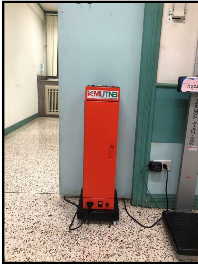
ทดลองฆ่าเชื้อในหน่วยงานอนามัย