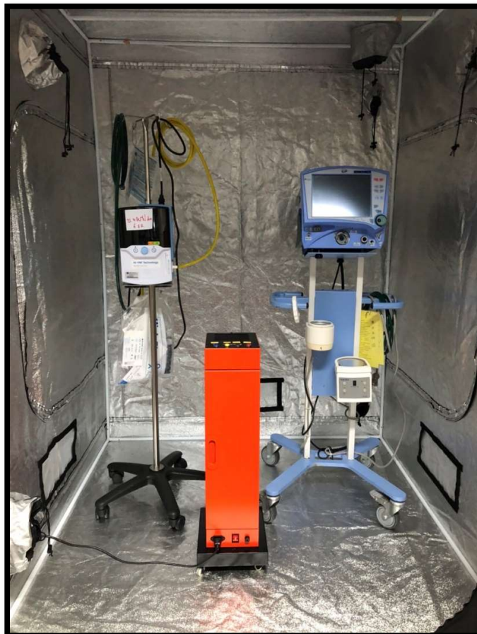
ทดลองฆ่าเชื้อในเครื่องมือแพทย์